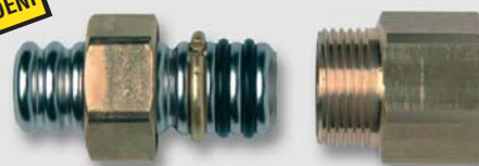
Art. Y5452x přechodka na vnitřní závit pro trubku TFG (plyn)