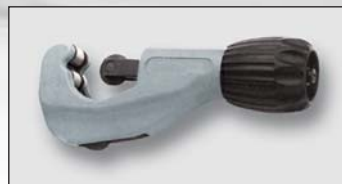
Art. Y43406 řezák TGL035 trubkový pro dimenze 3/8" – 1 1/4"