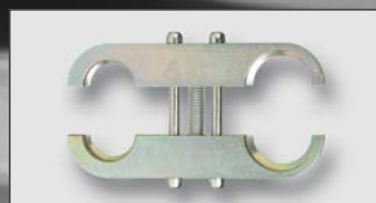
Art. Y43535 držák DIMA 60DB 1" – 1 1/4" voda, plyn