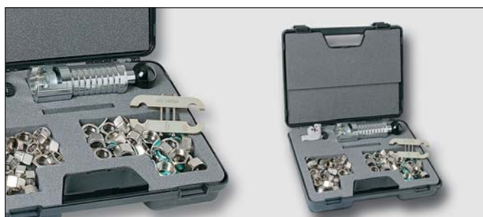
Art. Y43395 VGKIT 60DB - souprava obsahující: trubkový ruční lis 60DB s vyměnitelnou hlavou, držák DIMA 60DB pro trubky DN12 (1/2") DN15 (3/4") pro vodu, řezák trubek DN 3/8" – 1" 20 ks 1/2" a 3/4" matic s těsněním pro vodu a solar