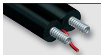
Art. Y540xx trubka DUAL SUN SET solar s elektrickým 4-žilovým kabelem