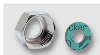
Art. Y434xx matice TFA redukováná včetně těsnění CENTELLEN (200°C) ISO 228