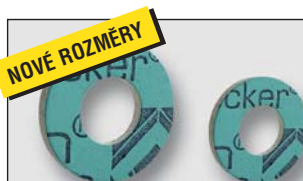
Art. Y434xx náhradní ploché těsnění CENTELLEN pro redukované matky TFA (tloušťka 2 mm, 200°C)