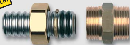
Art. Y5442x přechodka na vnější závit pro trubku TFG (plyn)