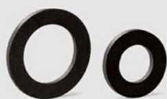
Art. Y435xx černé ploché těsnění z NBR pryže pro plynovou matici TFG (tloušťka 2 mm)