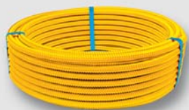
Art. Y43xxx trubka TFG pro rozvody plynu