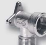
Art. Y5411x nástěnka UNI ISO 228