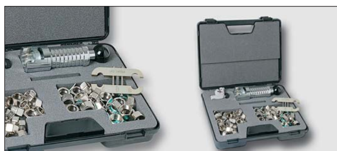
Art. Y43395 VGKIT 60DB - souprava obsahující: trubkový ruční lis 60DB s vyměnitelnou hlavou, držák DIMA 60DB pro trubky DN12 (1/2") DN15 (3/4") pro vodu, řezák trubek DN 3/8" – 1" 20 ks 1/2" a 3/4" matic s těsněním pro vodu a solar