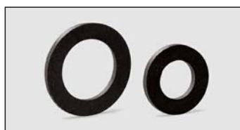
Art. Y435xx černé ploché těsnění z NBR pryže pro plynovou matici TFG (tloušťka 2 mm)