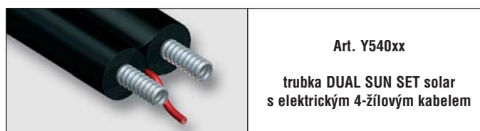
Art. Y540xx trubka DUAL SUN SET solar s elektrickým 4-žilovým kabelem