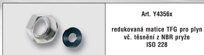
Art. Y4356x redukovaná matice TFG pro plyn vč. těsnění z NBR pryže ISO 228