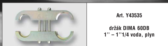
Art. Y43535 držák DIMA 60DB 1" – 1 1/4" voda, plyn