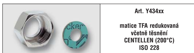
Art. Y434xx matice TFA redukováná včetně těsnění CENTELLEN (200°C) ISO 228