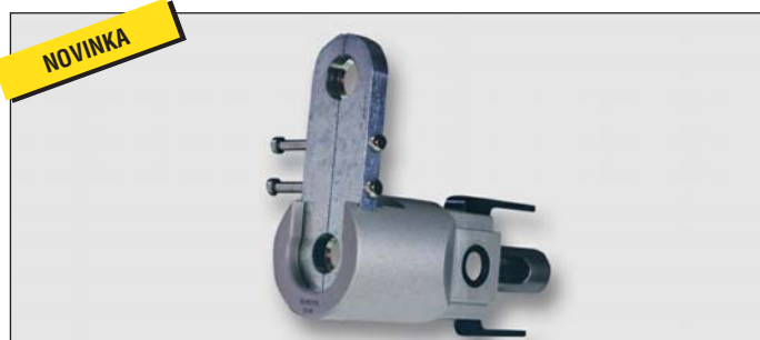
Art. Y43386 lisovací adaptér pro lisování trubek TFA a TFG pro použití (spolu s držáky DIMA) v radiálních lisech (nelze pro MINI pressy)