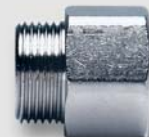
Art. Y434xx přechod UNI ŠM vnější ISO 228 / vnitřní ISO 7Rp