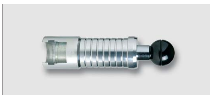
Art. Y43402 ruční lis 60DB DN10-25