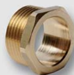
Art. Y540xx spojka trubek UNI s vnějším závitem G ISO 228 (použití spolu s převlečnou matkou)