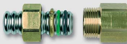
Art. Y540xx přechodka na vnitřní závit pro trubku TFA (voda, topení, solár)