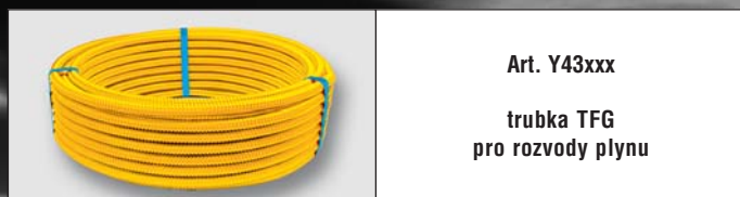
Art. Y43xxx trubka TFG pro rozvody plynu