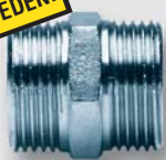
Art. Y434xx vsuvka spojovací UNI ŠŠ ISO 228