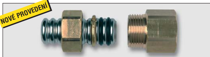
Art. Y5452x přechodka na vnitřní závit pro trubku TFG (plyn)