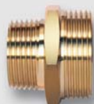
Art. Y5410x redukována vsuvka UNI ŠŠ ISO 7R / ISO 228