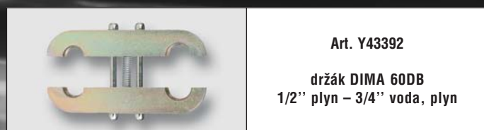
Art. Y43392 držák DIMA 60DB 1/2" plyn – 3/4" voda, plyn