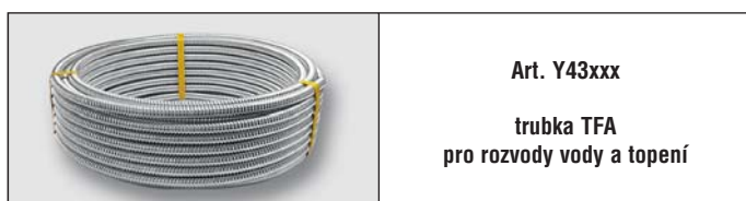
Art. Y43xxx trubka TFA pro rozvody vody a topení

Kompletní návody na montáž a instalaci systému EUROTIS najdete na www.rubidea.cz .