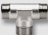
Art. Y435xx T-kus ŠŠŠ UNI ISO 228