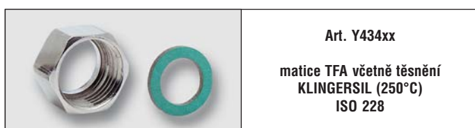
Art. Y434xx matice TFA včetně těsnění KLINGERSIL (250°C) ISO 228