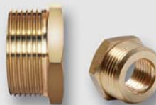
Art. Y5409x redukováný přechod UNI ŠM s vnitřním závitem vnější ISO 228 / vnitřní ISO 7Rp