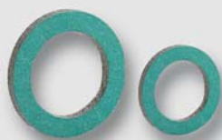
Art. Y5405x náhradní ploché těsnění KLINGERSIL pro matky TFA (tloušťka 2 mm, 250°C)