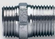
Art. Y434xx vsuvka přechodová UNI ŠŠ ISO 228 / ISO 7R