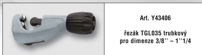
Art. Y43406 řezák TGL035 trubkový pro dimenze 3/8" – 1 1/4"