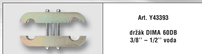
Art. Y43393 držák DIMA 60DB 3/8" – 1/2" voda