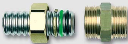
Art. Y5406x přechodka na vnější závit pro trubku TFA (voda, topení, solár)